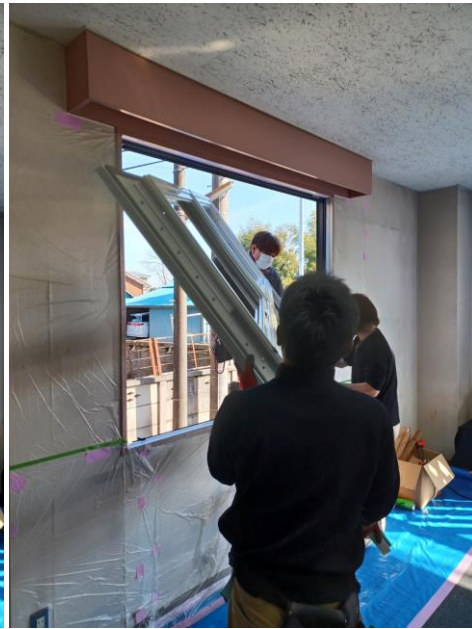
3:作成済みの樹脂枠をはめる