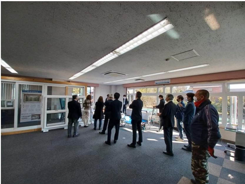
IBclubのメンバー ICさん真剣に見学