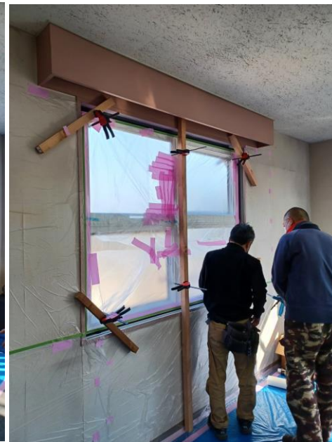
4:養生して発砲ウレタン注入